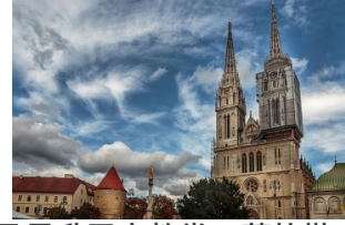
圣母升天大教堂（萨格勒布大教堂）