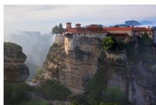
梅黛奥拉天空之城

（注：6座修道院的开放时间各不相同，视当天情况选择可以参观的修道院，一般参观2座修道院。修道院有严格的着装规定，不得裸露肩膀或膝盖，女性必须穿裙子。如果没有裙子，修道院门口提供围裙可以借用，请在入场前借一条。）