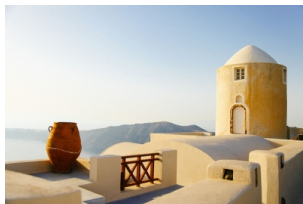
菲拉 (FIRA) 小镇