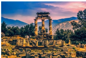
德尔菲遗址和博物馆