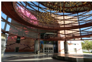
加利福尼亚科学中心

比赛，感受斯台普斯球场沸反盈天的篮球气氛，并且中场休息时还可以欣赏到精彩的拉拉队、吉祥物以及嘉宾表演。（NBA的时间视实际情况安排调整，以最终确认为准。）